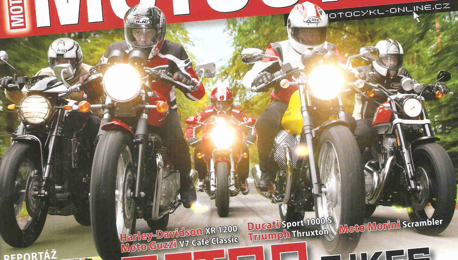
Harley-Davidson XR 1200 Moto Guzzi V7 Café Classic