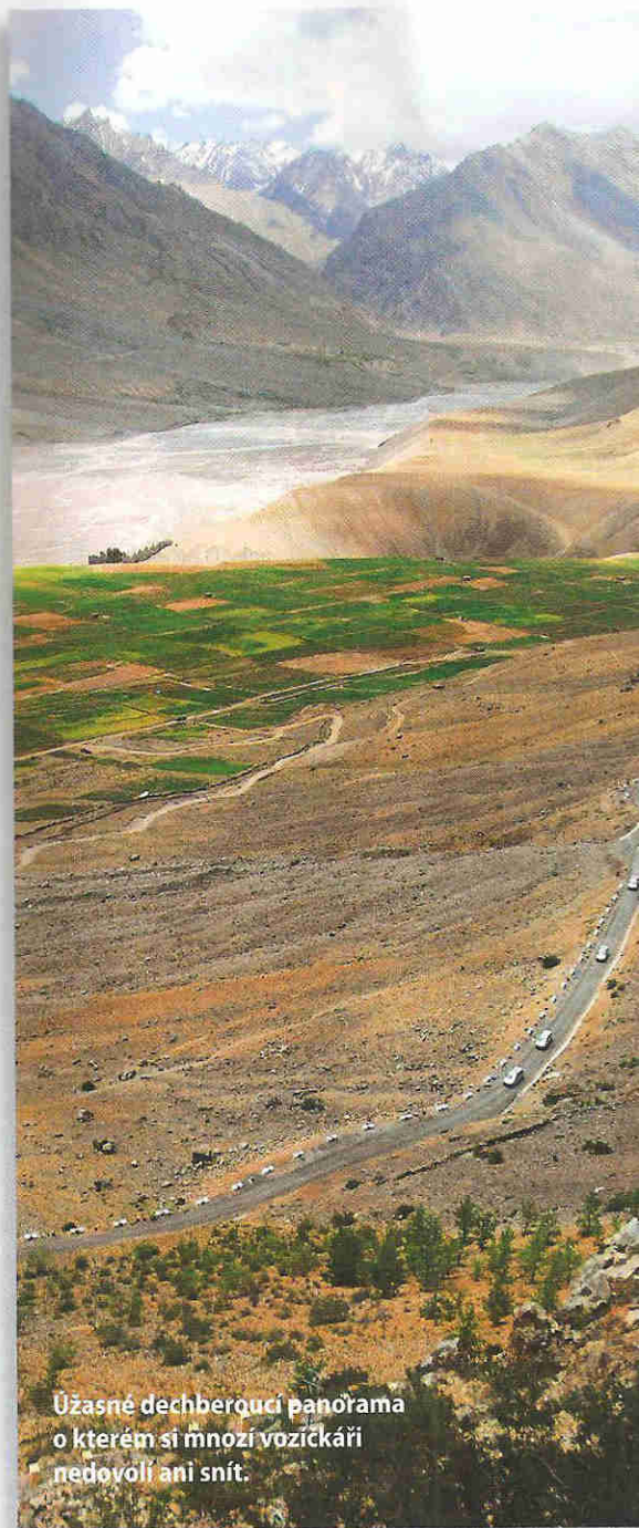
Úžasné dechberoucí panorama o kterém si mnozí vozíčkáři nedovoli ani snít.