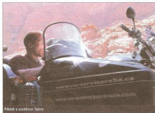
Fotník v součase Teďra